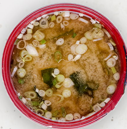
YA-16 Мисо шөл みそ汁 Miso soup 2.5k