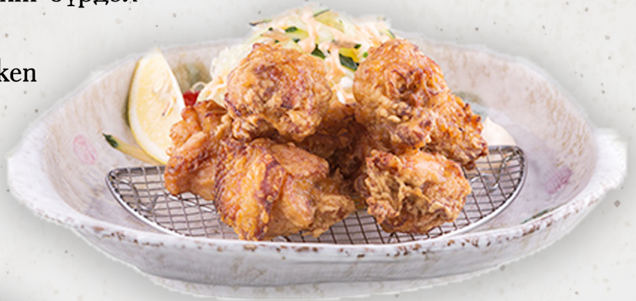
SET-10 24.5k Шарсан тахианы иж бүрдэл 鶏の唐揚げ定食 Japanese fried chicken Kcal 1158