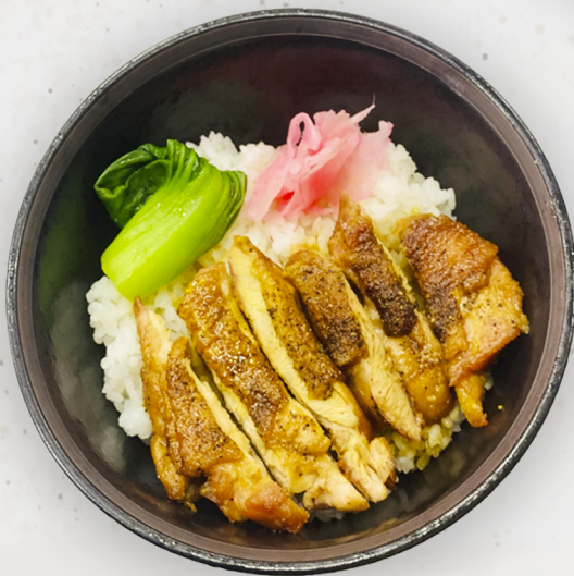
SET-12 21.5k Терияки донбүри 照り焼き丼 Teriyaki donburi Kcal 795