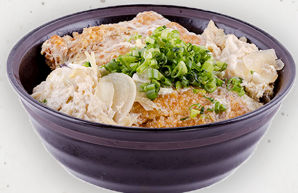
SET-1 23.5k Бүрж шарсан гахайн махан донбүри かつ丼 A deep fried pork cutlet rice bowl Kcal 2945