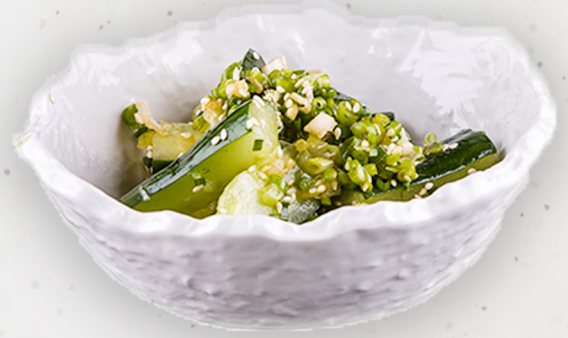
AP-3 15.5k Амталсан огурцы 冷やし辛味キュウリ Spicy cold cucumber Kcal 45