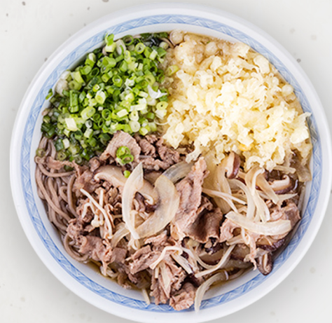
NO-5 23.5k Үхрийн мах соба 牛肉蕎麦 Tender beef and soba soup Kcal 998