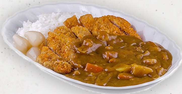
SET-19 28.5k Бүрж шарсан гахайн махтай каре カツカレー Pork cutlet curry with rice Kcal 2067