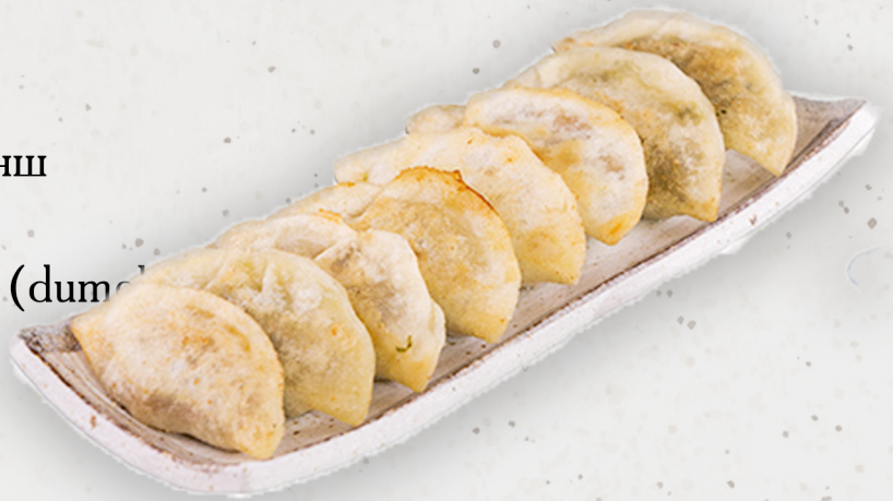
AP-8 22.5k Гэрийн шарсан банш 自家製餃子 Hand made Gyoza (dumplings) Kcal 1132