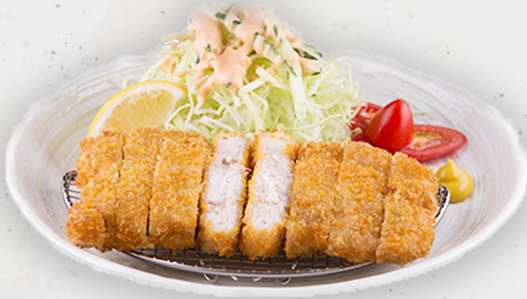
SET-2 28.5k Бүрж шарсан гахайн махан иж бүрдэл トンカツ定食 Tonkatsu set