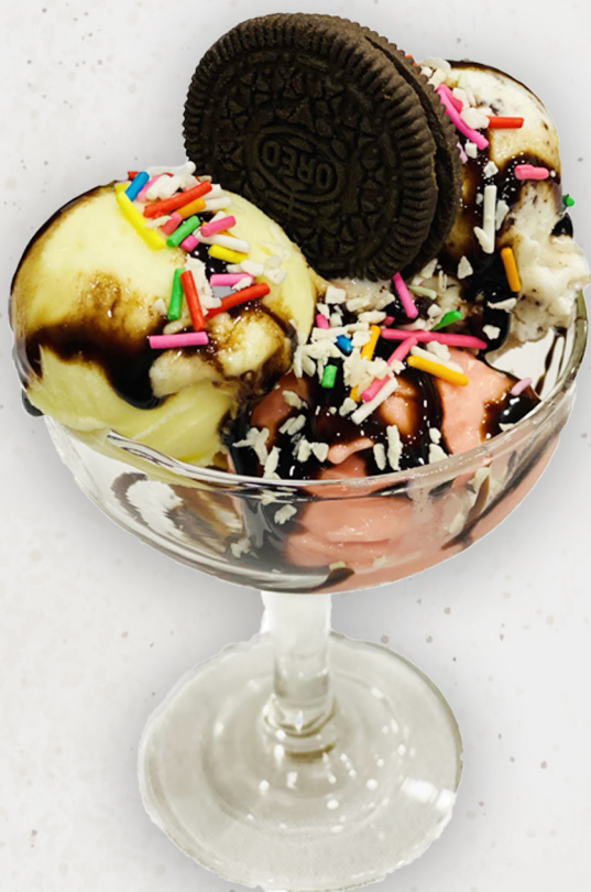
ZA-1 . 5.5k Зайрмаг /4 төрөл/ сонголтоор アイスクリーム/4種類/ Ice cream /Vanilla, Chocolate, Chocolate chip, Strawberry, Caramel, Sour cream/