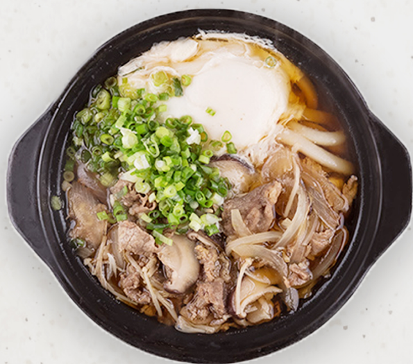
NO-7 20.5k Үхрийн мах үдон гурилтай шөл 牛肉鍋うどん Beef udon noodles soup Kcal 649