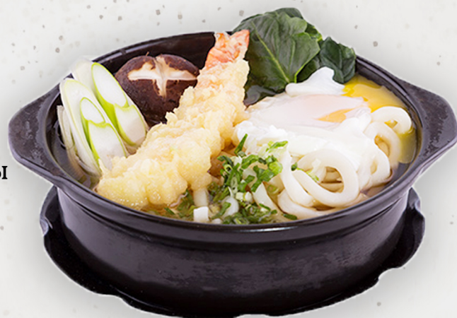
NO-1 27.0k Бүрж шарсан сам хорхой, тахианы мах, үдон гурилтай шөл 鍋焼きうどん Shrimp tempura udon noodles soup Kcal 1062