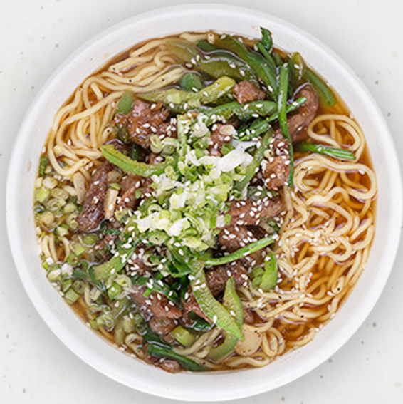
NO-8 24.5k "Секитэй" нэрийн рамен 石庭ラーメン "Sekitei" ramen noodles soup w/stir-fried tender beef Kcal 1400