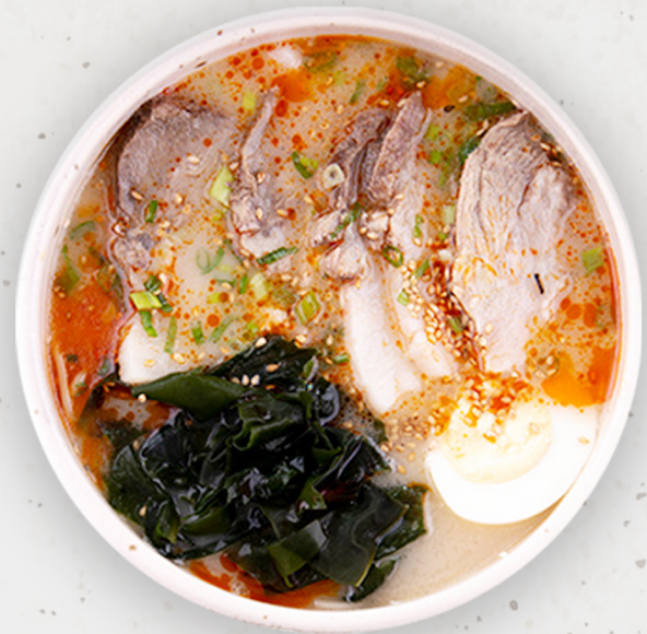
NO-25 22.5k Халуун ногоотой тонкоцу рамен 豚骨ラーメン /辛味/ Spicy Tonkotsu Ramen Kcal 1380