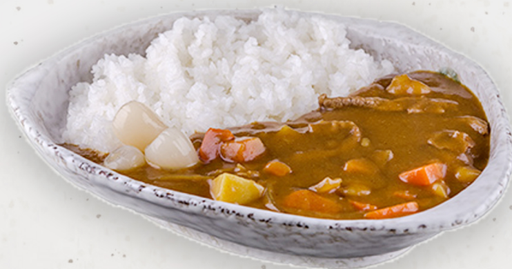
SET-44 22.5k Үхрийн махтай каре ビーフカレー Beef curry Kcal 1017