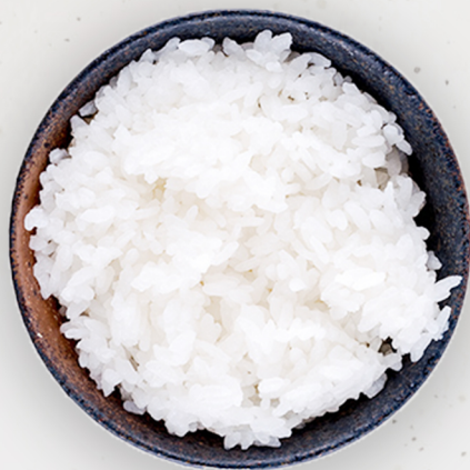
YA-14 Будаа ご飯 Rice 3.5k