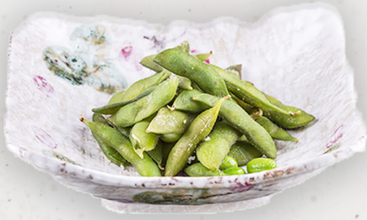
OT-1 14.5k Чанасан буурцаг 枝豆 Boiled green soybeans Kcal 571